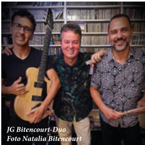
JG Bitencourt-Duo